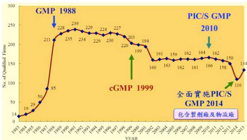
圖表 3：國內藥廠數消長趨勢圖

以 2015 年為例，即便「假設」智慧局所核准及歸屬本國人之藥品專利(246 件)與生物技術專利(346 件)，均由符合國際 GMP 標準之國內藥廠持有，每個國內藥廠該年度獲准之專利數量僅為 4.42 件，更遑論實際上之本國專利權人可能為大專院校或學術研究機構。由此顯見我國藥廠在投入研發、累積專利權及其他智慧財產面向上，仍有相當大的努力空間。若未往此方向努力，我國醫藥產業不僅難以轉型，產銷之相關醫藥產品在國際間亦難有較強的競爭優勢。放眼未來，在行政院於 2016 年核定「臺灣生物經濟產業發展方案」之政策推動、藥事法及專利法相關鼓勵研發之修法努力下，能否進一步深化我國生技醫藥產業發展、強化國內藥廠在智慧財產領域之重視及提升我國醫藥業者之國際競爭力，值得各界持續關注。