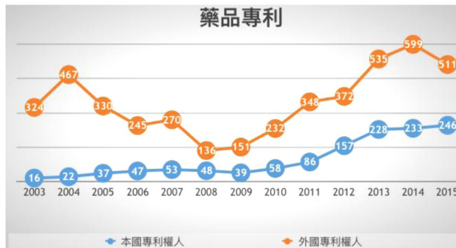
圖表 2：生物技術專利之統計（作者製圖表。資料來源：智慧局歷年年報專利統計）